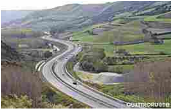
Anas - Traffico in crescita del 2,45% nel 2016 (Quattroruote)