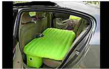
20 invenzioni 'Mai Viste Prima' che ti semplificheranno di brutto la vita (Viralnova.it)