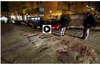
Agguato a Ponticelli: un morto e un ferito